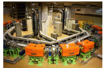
重粒子線医学研究センター